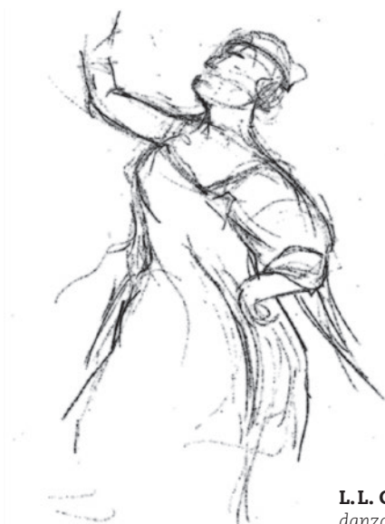
L.L. Gorian , dibujo gestual de danzante , 2021. © L.L. Gorian.

Elige la figura que quieres dibujar. Busca las líneas y formas más prominentes. Siempre comienza con líneas claras y luego aumenta la oscuridad a medida que avanzas. Recuerda: sin borrar, sin detalles y sin sombreado.